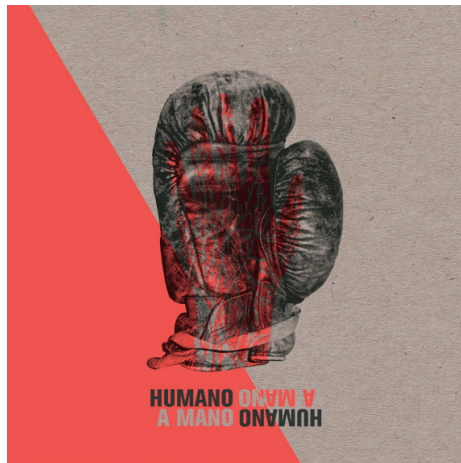
Humano a Mano - 2016